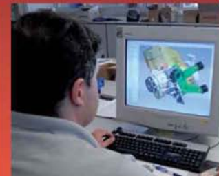
The complete project is developed using the latest 3D software.